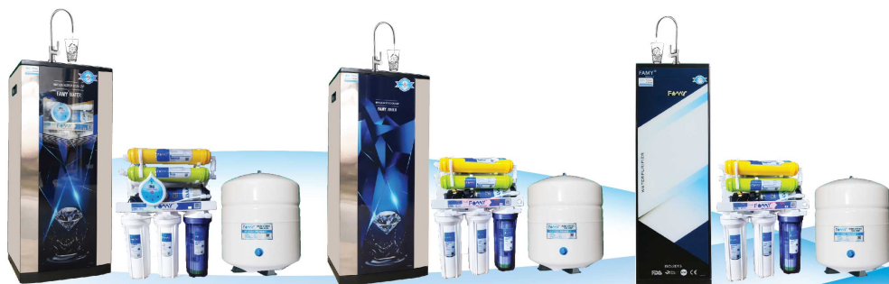
Model: IRO9IQ - A

IRO9IQ-A / IRO9IQ-A IRO9IQ-HA / IRO9IQ-HA