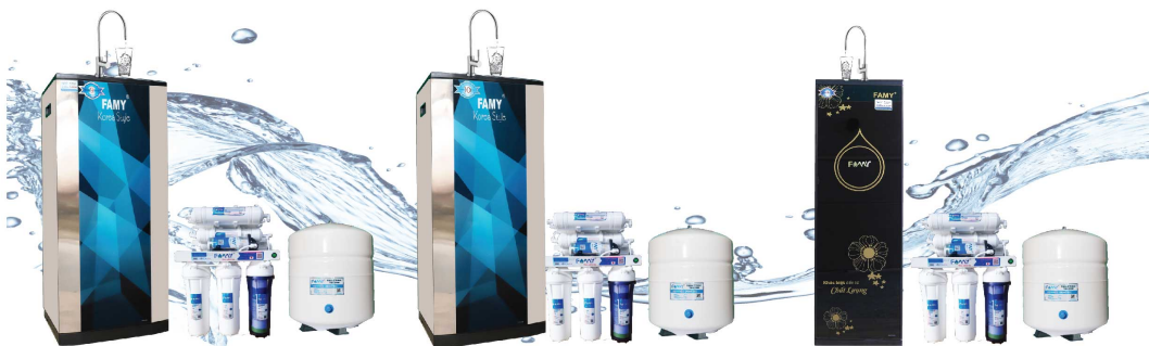
Model: KR9IQ - HA